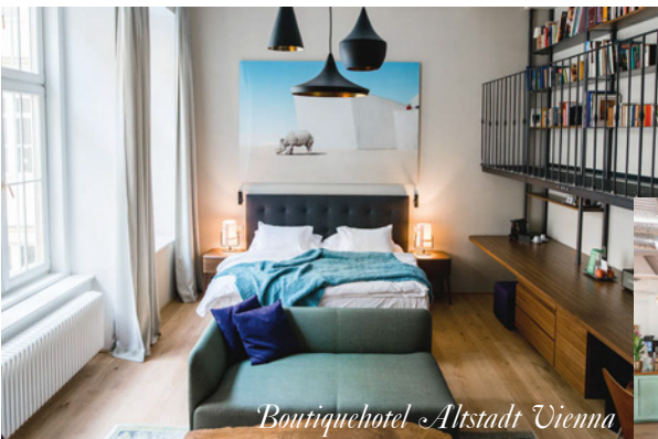
Boutiquehotel Altstadt Vienna

Vorschläge für einen Wochenend-City-Trip? Drei neue Suiten gibt es im ALTSTADT VIENNA zu entdecken, und sie unterstreichen mit Stil und Eleganz das Wiener Lebensgefühl. Architekt Roland Nemetz hat von der Stadt inspiriert „Josef Hoffmann“, „Library“ und „Opera“ gestaltet. Ob ins Wiener-Werkstatt-Gefühl gebettet oder in klassische Musik getaucht – die neuen Suiten im Altstadt sind ein wunderbarer Ort, von dem aus man die Stadt erkunden kann. Und was wäre die ohne Kaffeehäuser? Nicht die gleiche! Weil man für diese Pflege des kulturellen Erbes auch einen anständigen Kaffee braucht, gibt es das WIENER RÖSTHAUS im Prater. Die Kaffees, die einem hier angetragen werden, zählen zu den edelsten der Welt, und man kann sie auch als ganze Bohnen oder in den unterschiedlichsten Mahlungen mit nach Hause nehmen. Stilvolle Souvenirs gibt es im neuen IMPERIAL SHOP zu erstehen. Ehemalige k.u.k.-Hoflieferanten, Traditionsunternehmen und in Wien beheimatete Manufakturen bieten ihre Ware in der Hofburg feil. Diese Objekte passen definitiv in österreichische Wohnzimmer! altstadt.at , imperialshop.at , wienerroesthaus.at